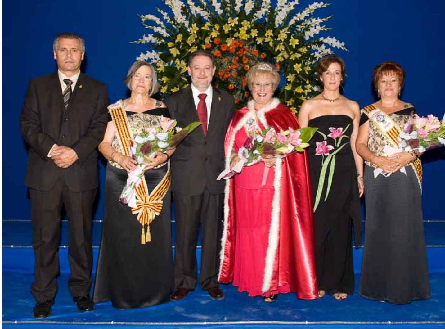
Feria y Fiestas 2009