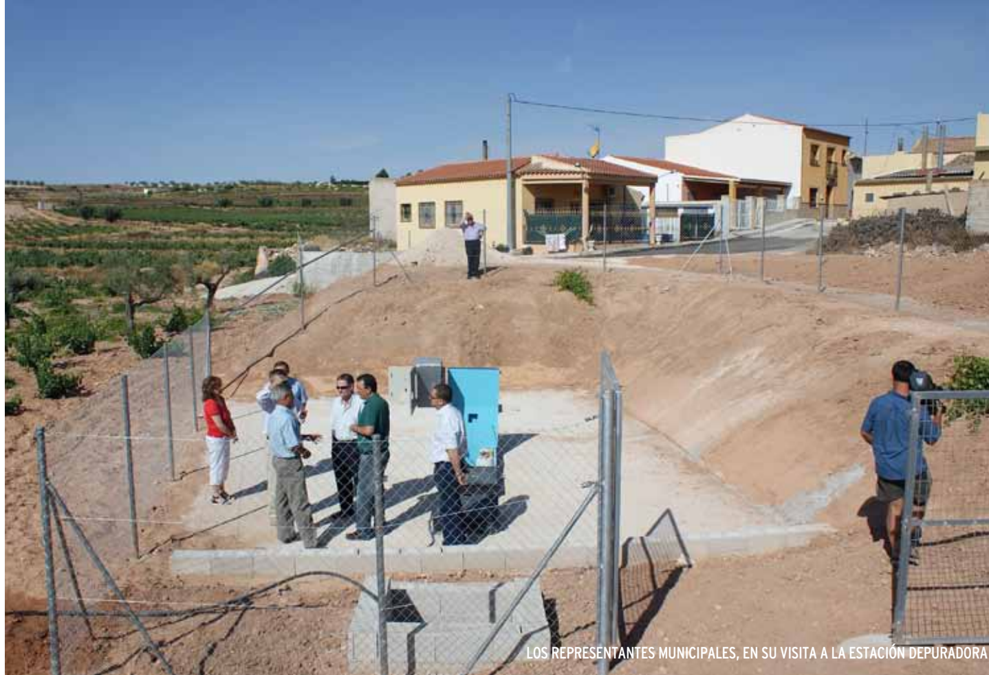
LOS REPRESENTANTES MUNICIPALES, EN SU VISITA A LA ESTACIÓN DEPURADORA