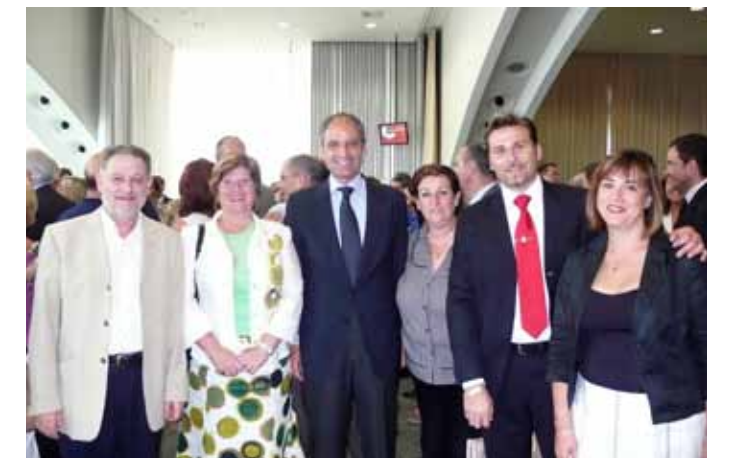
EL ALCALDE DE PINOSO Y LOS DE OTRAS LOCALIDADES, CON EL PRESIDENT CAMP

El Alcalde de Pinoso se mostró satisfecho porque casi todos los proyectos presentados han sido aprobados, y espera que pronto se conviertan en realidad y generen empleo.