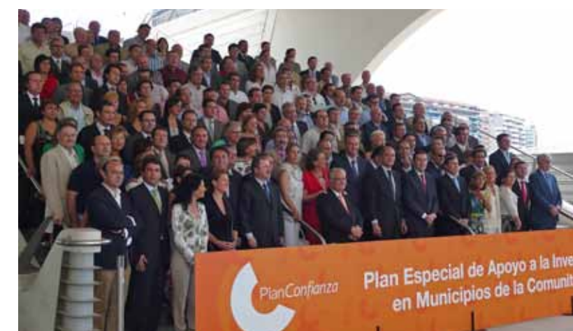
FOTO DE FAMILIA DE LOS MIEMBROS DEL CONSELL CON LOS ALCALDES DE LA COMUNITAT VALENCIANA