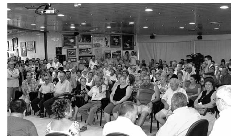
ASPECTO QUE PRESENTABA LA CASA DEL VINO EN LA REUNIÓN CONVOCADA POR LA OPOSICIÓN ACERCA DE LA SUBIDA DE IMPUESTOS

En intervenciones posteriores ante los medios locales, miembros del Equipo de Gobierno, entre ellos el Alcalde, anunciaron la eliminación para 2010 de dos personas contratadas como personal de confianza, y concretaron las subidas, ya más moderadas, que experimentarían algunos impuestos: el impuesto de bienes inmuebles registrará un aumento del 30%, la recogida de basuras el 80% y el impuesto de vehículos el 40%.